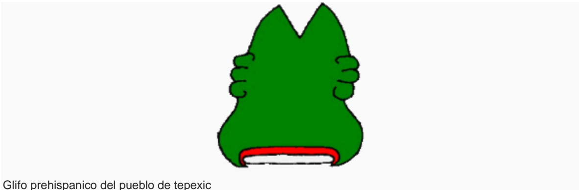
Glifo prehispánico del pueblo de tepexic