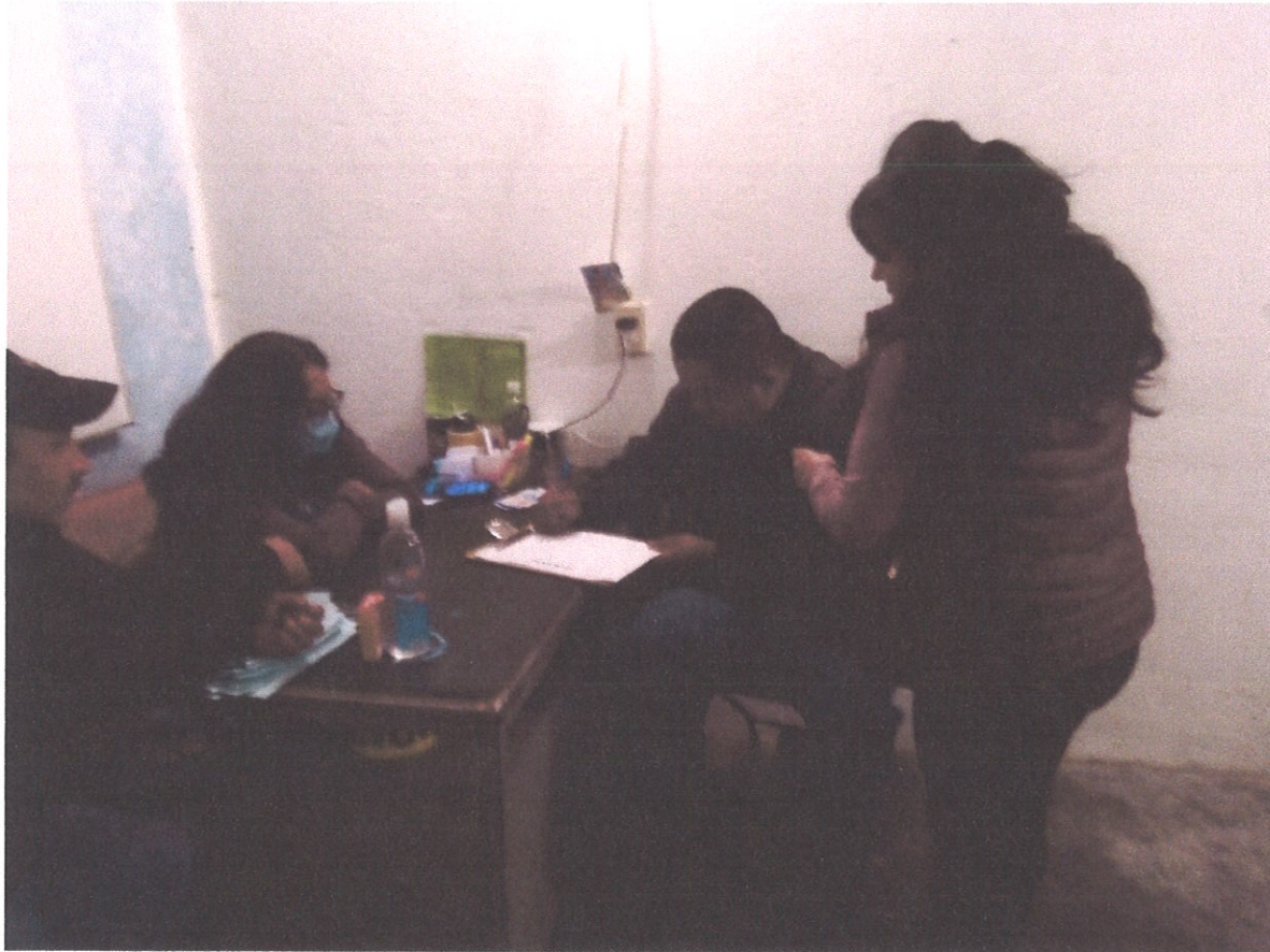
ENTREGA DE APOYO A COMITE DE FESTEJOS DE SAN ILDEFONSO