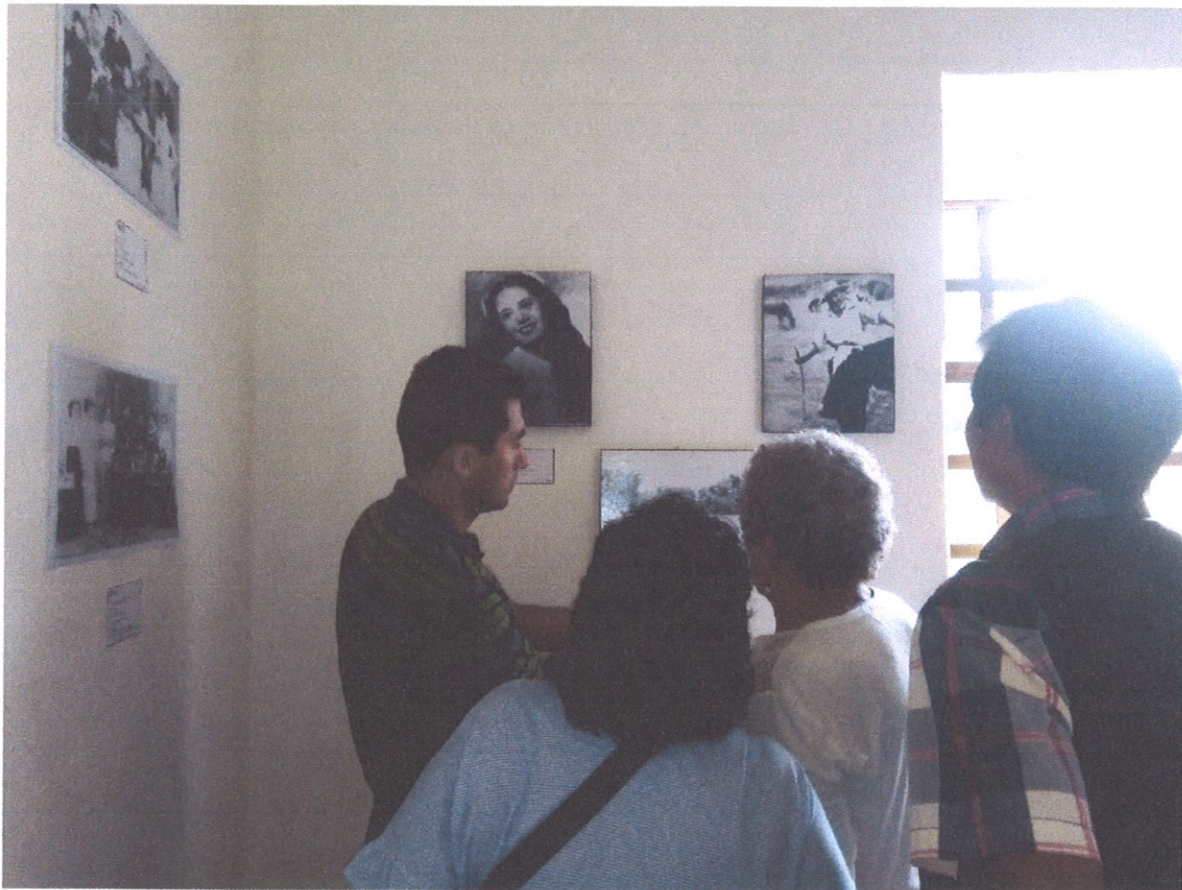
VISITANTES AL MUSEO COMUNITARIO SANTIAGO TLAUTLA