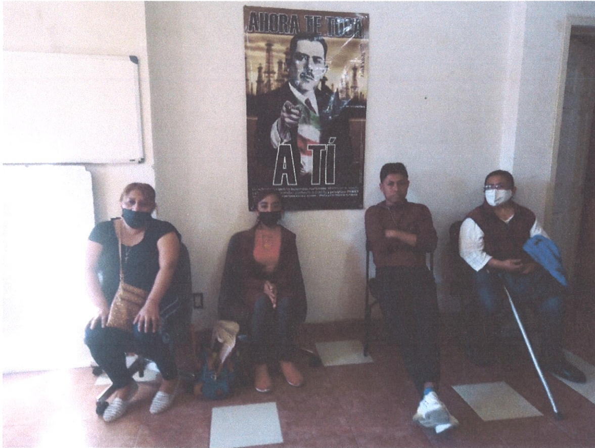
CIUDADANAS DE CAÑADA Y EL CARMEN SOLICITANDO APOYO