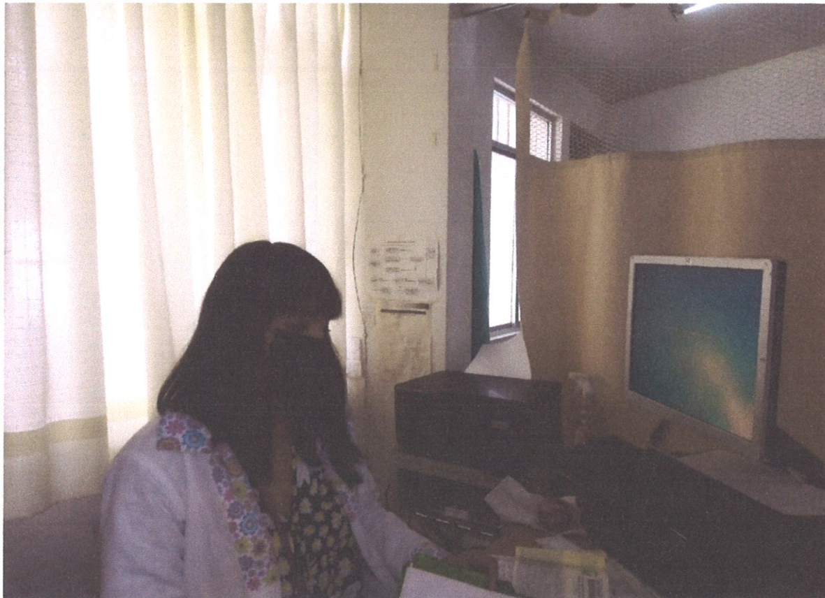
DOCTORA DEL CENTRO DE SALUD SANTIAGO TLAUTLA