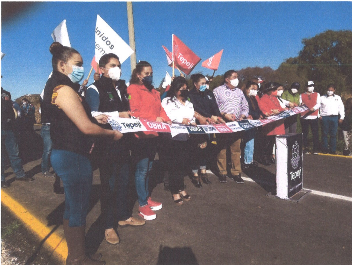
INAUGURACIÓN DE LA CALLE ENTRADA A LOS PINOS EL CERRITO