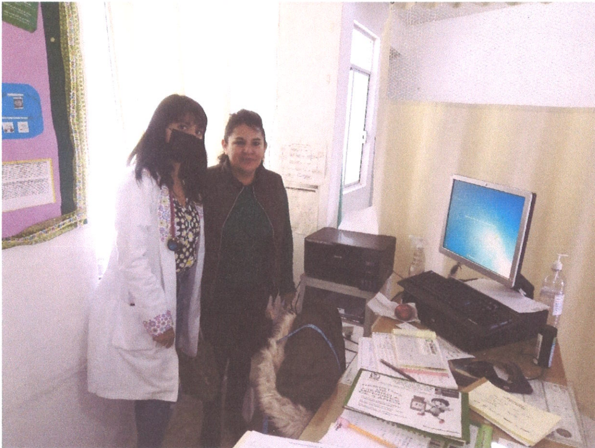
CENTRO DE SALUD DE SANTIAGO TLAUTLA