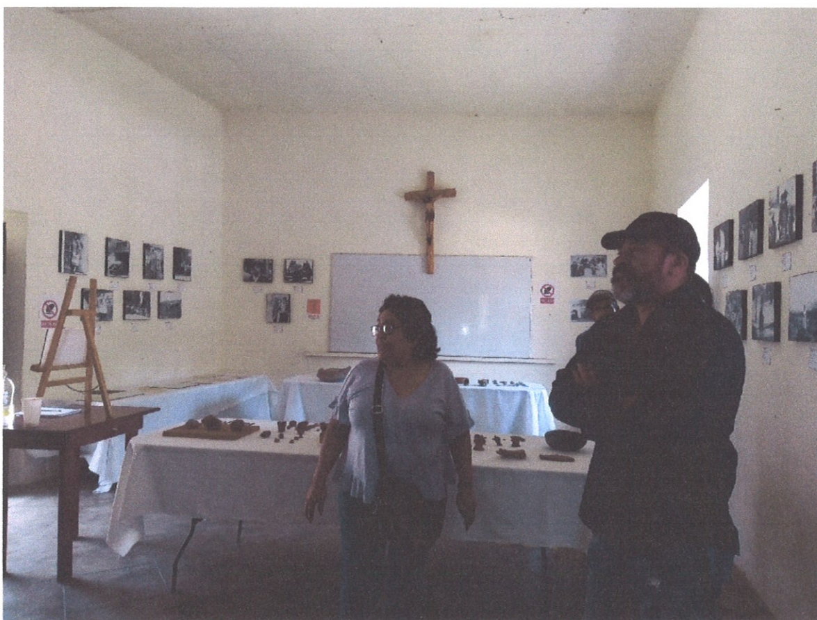
VISITANTES AL MUSEO COMUNITARIO SANTIAGO TLAUTLA