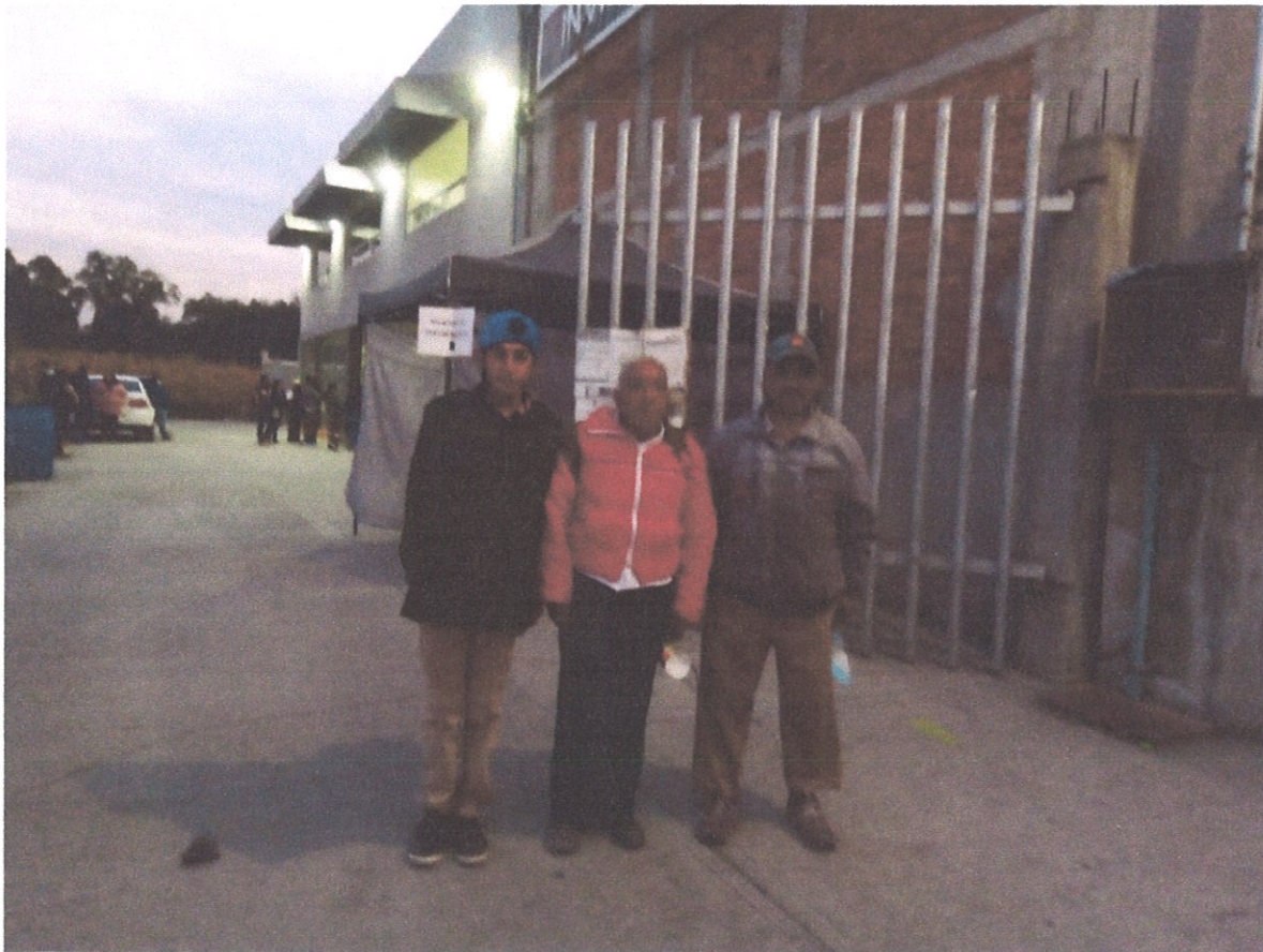
ATENCION CIUDADANA A ADULTOS MAYORES DE TLAXINACALPAN PARA TRAMITE DE INE EN TULA