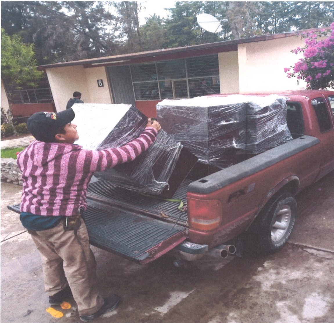
MUEBLES DONADOS POR LA SEP A LA ESCUELA PRIMARIA JULIÁN VILLAGRÁN (FLETE)