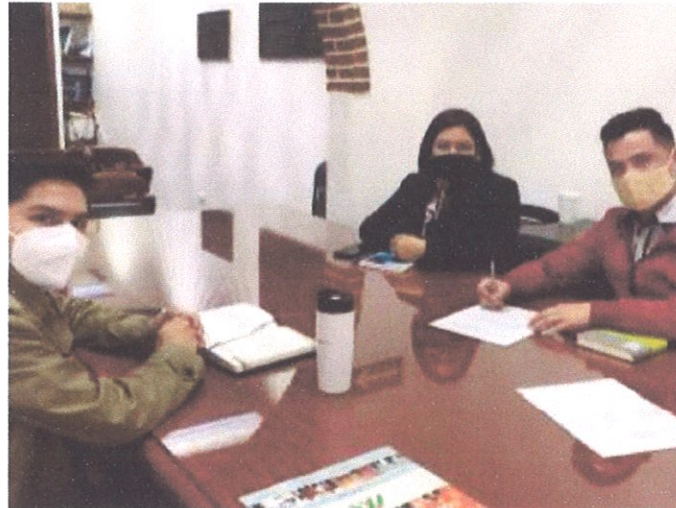
Ilustración 2.- Mesa de trabajo de la Comisión de Gobernación, Bandos, Reglamentos y Circulares.