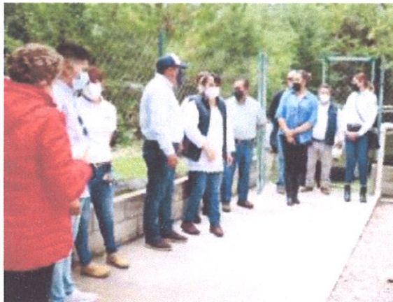
Ilustración 7.- Recorrido en las plantas tratadoras.

20 de junio del 2021.- dentro del marco de actividades se realizó un recorrido de supervisión en las plantas tratadoras de aguas residuales con el objetivo de verificar su funcionalidad.