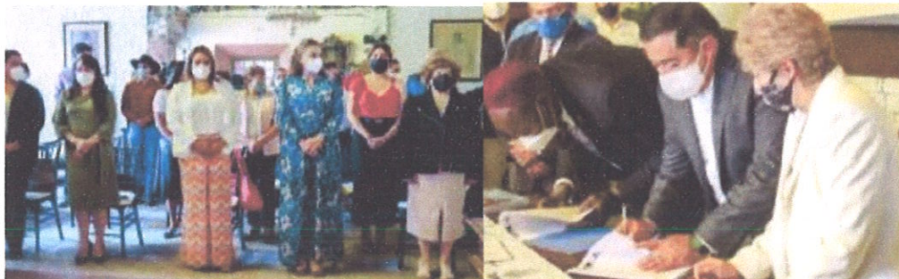
Ilustración 6.- Participación en promover el turismo.

15 de junio del 2021.- Con el objetivo de promover intercambios culturales, intelectuales, deportivos, así como la promoción y fenómeno del turismo y desarrollo económico. Acudí a la hacienda de caltengo a la firma de hermanamiento de Tepeji del Rio con el estado de New Jersey.