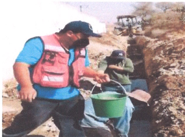
Ilustración 4.- Reconstrucción de tubería en Tianguistengo.

Donde se beneficiaron así a 30 familias que llevaban aproximadamente más de 15 años con la problemática de escasez del agua potable.