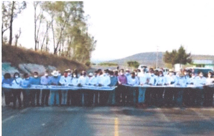
Ilustración 5.- Reconstrucción de la carretera México - Querétaro.