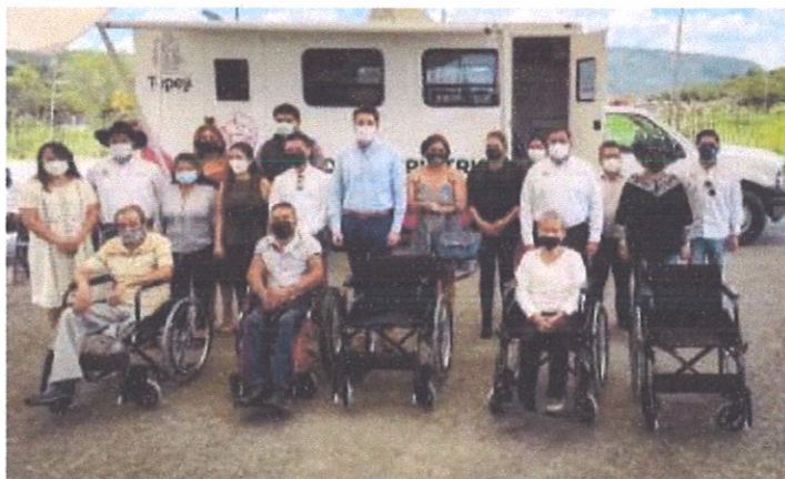
Ilustración 8.- Donaciones de atención médica.

02 de agosto del 2021.- se hizo entrega de una unidad geriátrica móvil en el DIF de Tepeji del Rio, para brindar atención médica a los adultos mayores.